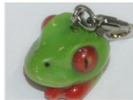
3D-Druck bei fabioo.com

Eine fehlende Spielfigur für das Brettspiel, ein kaputter Brillenbügel oder die ganz individuelle Handy-Halterung - in Millionen deutschen Haushalten könnten solche Dinge bald aus dem Drucker kommen. Jeder fünfte Bundesbürger (20 Prozent) kann sich vorstellen, einen 3D-Drucker zu nutzen, mit dem am PC entworfene Modelle als reale Gegenstände aus Kunststoff oder anderen Materialien ausgegeben werden können.